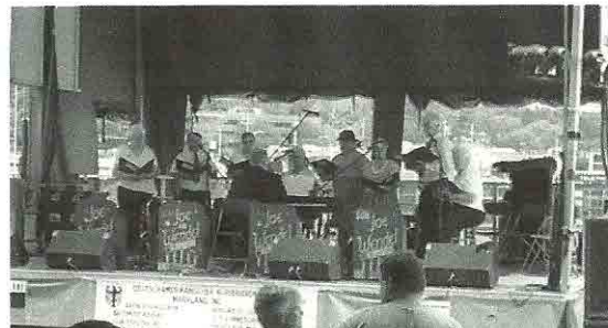
Der Arion Gesangverein singt wunderschöne deutsche Lieder.