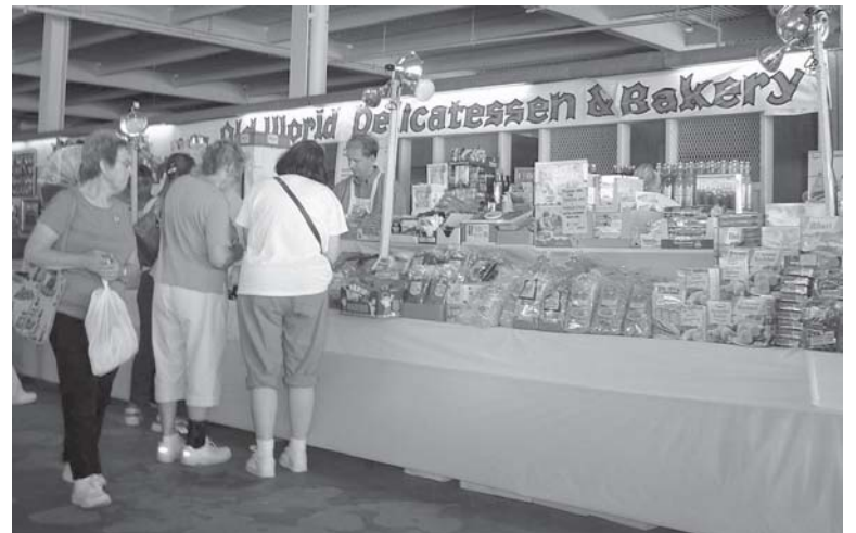
Allerlei deutsche Lebensmittel und Kekse sind bei "Old World Deli und Bäckerei" zu finden.